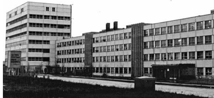
В 1979 промплощадка ТОАЗа выглядела совсем не так, как сегодня. И деревья были совсем маленькие

Подходит к концу декабрь. Первый аммиак в работе, на третьем заканчивают реконструкцию холодильников «Лумус» и испытали печь риформинга, на четвёртом готовят к сдаче центральный пульт управления.