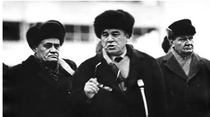
В 9 утра 21 декабря закончены гарантийные испытания оборудования на первом агрегате карбамида. Подписан протокол №2

29 ноября первый агрегат карбамида впервые достиг проектных показателей: 530 тонн в смену. 30 ноября суточная выработка составила 1495 тонн – всего на 5 тонн ниже проекта.