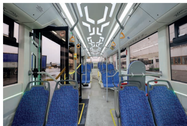
Для корпоративного трансфера ТОАЗ тестирует новый вид транспорта. До города – электробус, на промплощадке – микроавтобус на электротяге