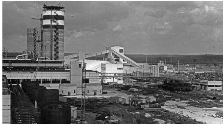
29 ноября первый агрегат карбамида впервые достиг проектных показателей: 530 тонн в смену