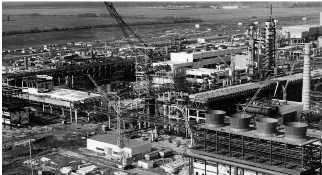
Пятый и шестой агрегаты аммиака в процессе монтажа оборудования. 29 ноября первый агрегат карбамида впервые достиг проектных показателей: 530 тонн в смену