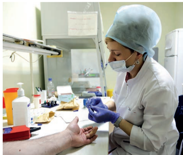
Процедурный кабинет осуществляет забор биологических проб для анализов

Для сотрудников, прикрепленных к медсанчасти ТОАЗа, продолжается диспансеризация. До 39 лет её проходят раз в три года, затем ежегодно. Если вы проходите периодический медосмотр, диспансеризация доступна по вторникам и четвергам в кабинете №212 и без записи. В других случаях – после звонка в регистратуру по тел.: 14-22.