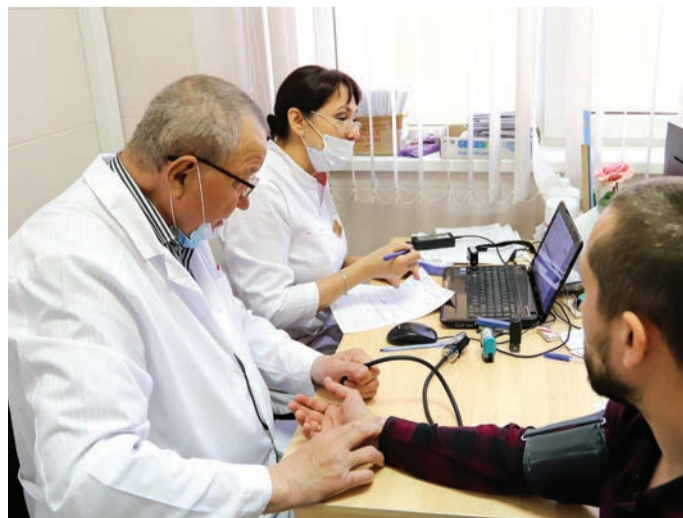
Первые врачи, с которыми имеют дело работники ТОАЗа, приходят в медсанчасть, – участковые терапевты